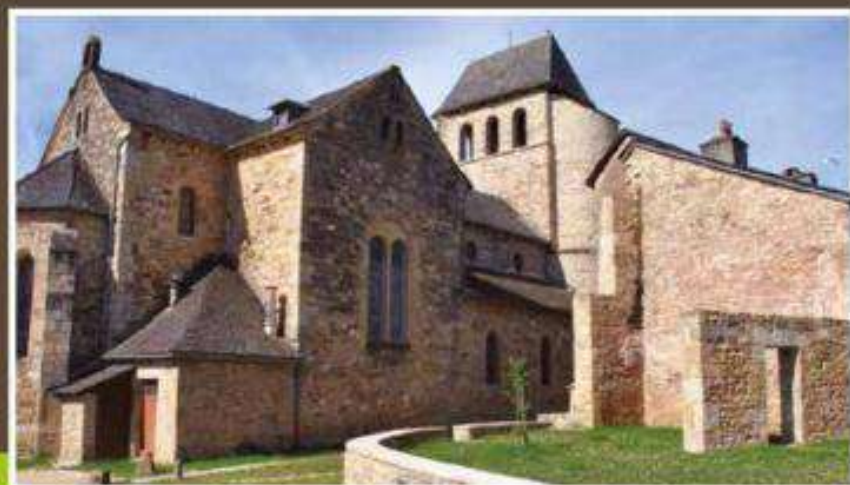
Coeur du village fortifié